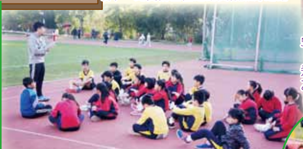
(第二日比賽)熱身後，房Sir與各運動員進行賽前Briefing