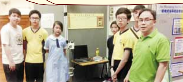
參加香港大學主辦的「水平面量度裝置」比賽：我校其中一組作品。作品是「Laser Sea Level Meter」。比賽中獲得「最準確量度大獎」。組員及指導老師合照