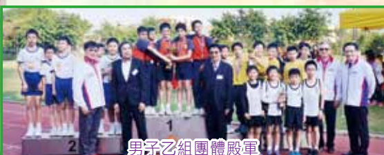
男子乙組團體殿軍