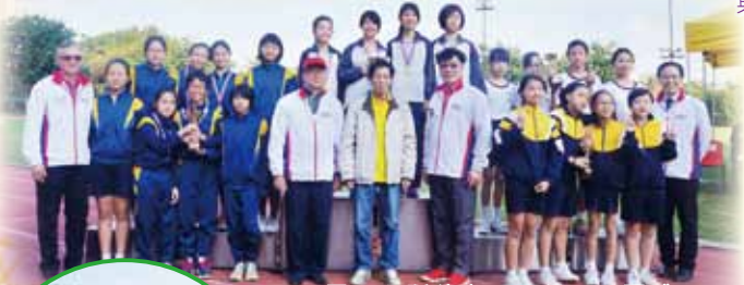
天靈田徑隊的女子甲組取得團體及4×100米接力季軍！