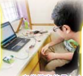
在常識室使用Arduino咭片式微電腦編程及測試情景。