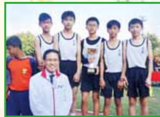
男子甲組稱霸元朗區，勇奪團體冠軍！