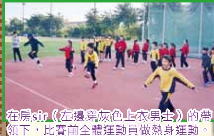
在房sir(左邊穿灰色上衣男士)的帶領下，比賽前全體運動員做熱身運動。