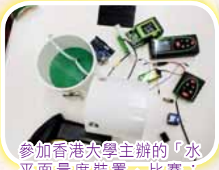
參加香港大學主辦的「水平面量度裝置」比賽：我校其中一組作品中的配件。作品是「Laser Sea Level Meter」。比賽中獲得「最準確量度大獎」。