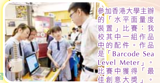
參加香港大學主辦的「水平面量度裝置」比賽：我校其中一組作品中的配件。作品是「Barcode Sea Level Meter」。比賽中獲得「最佳創意大獎」。圖中被參觀者發問時情景。