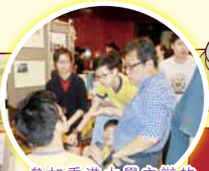
參加香港大學主辦的「水平面量度裝置」比賽：我校其中一組作品。作品是「Laser Sea Level Meter」。比賽中獲得「最準確量度大獎」。圖中被參觀者發問時情景。