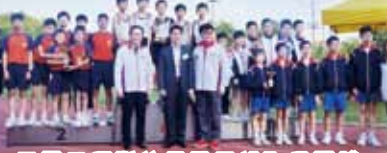
天靈田徑隊的男子甲組取得團體冠軍及4×100米接力亞軍！