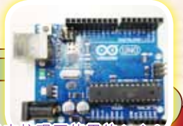
這是本校現正使用的Arduino咭片式微電腦底板，平宜、方便、容易學習。