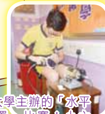
參加香港大學主辦的「水平面量度裝置」比賽：小六同學正在製作「Laser Sea Level Meter」。比賽中獲得「最準確量度大獎」。