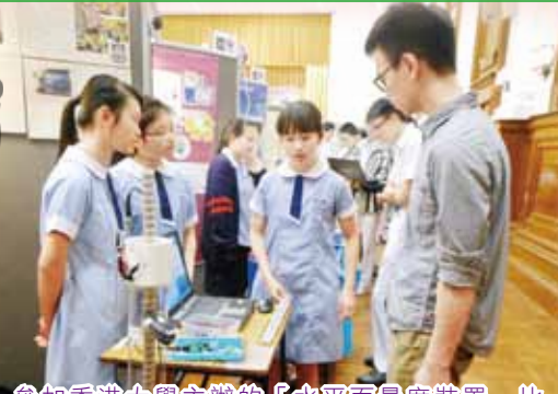
參加香港大學主辦的「水平面量度裝置」比賽：我校其中一組作品。作品是「Laser Sea Level Meter」。比賽中獲得「最準確量度大獎」。圖中被參觀者發問時情景。